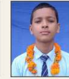
529457 नमन प्रमो / विष्णु स्वरूप वासुदेव, मंडर आगरा (उ.प्र.)