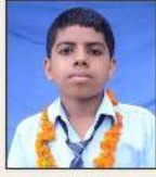
817916 शिव वशिष्ठ / प्रकेश दत्त जलत, धनीगढ (हरि.)