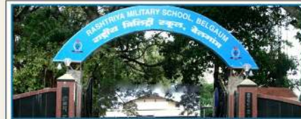
RASHTRIYA MILITARY SCHOOL, BELGAUM

Address : Ajmer, Rajasthan - 305 001 Email : militaryschoolajmer@gmail.com Website : www.rastriyamilitaryschoolajmer.in Phone : 0145-2424105 Fax : 0145-2426642