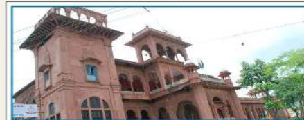
RASHTRIYA MILITARY SCHOOL, DHOLPUR

Address : PB. NO. 25040, Museum Road Post Office, Opp Johnson Market Hoar Road, Bangalore, Karnataka - 560 025 Email : bangalore@rastriyamilitaryschools.in | Website : www.rastriyamilitaryschools.in Phone : 080-25554972 Fax : 080-25308131