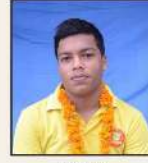
818666 अमनदीप / नेनेन्द्र प.न. 871, राजीव नगर, समसबाद फारुख (हरि.)