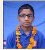
824792 सिद्धांत आर्च / रामनिवास गोबल, रामबाग, नरेशी दुदरी (हरि.)