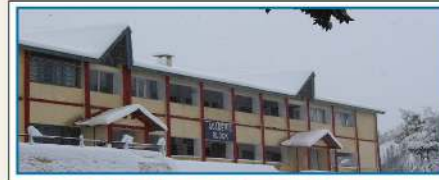
RASHTRIYA MILITARY SCHOOL, CHAIL

Address : Chail, (Shimla Hills), (H.P.) - 173 217 Email : chail@rastriyamilitaryschool.in Website : www.rastriyamilitaryschools.in/chail Phone : 01792-248226 Fax : 01792-248750