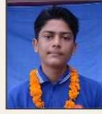
812686 हर्ष पंजाब / संजय पंजाब 126, पृथ्वीराज अग्र मार्ग छोटी शहीदाबाद (म.प्र.)