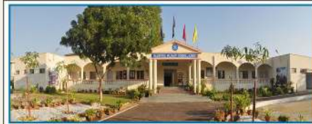
RASHTRIYA MILITARY SCHOOL, AJMER

Address : Chail, (Shimla Hills), (H.P.) - 173 217 Email : chail@rastriyamilitaryschool.in Website : www.rastriyamilitaryschools.in/chail Phone : 01792-248226 Fax : 01792-248750