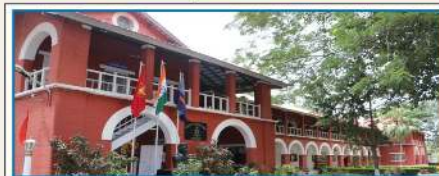
RASHTRIYA MILITARY SCHOOL, BANGALURU

Address : Camp, Belgaum, Karnataka - 590 009 Email : principalbmgm@gmail.com Website : www.militaryschoolbelgaum.edu.in Phone : 0831-2407531, 2407530 Fax : 0831-2402845