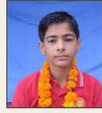
818517 आदित्य / प्रदीप कुमार श्रेष्ठपुरा, धौद कानन (हरि.)