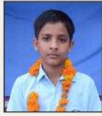
534100 अयान / श्री मुनिराक हुसैन वाई नं. 8, अधुना मीलना साहूवापुर, चूरु (राज.)