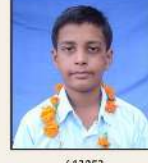
613053 कुण्डला विनय / के. माधव राव पेट्टावना, एण्ट, कल्लिआ आगारा श्रीकाकुल्लर (आ.प्र.)