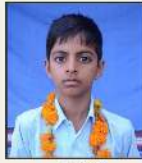
556229 कुनाल / अविनाश सलीमपुर, बोकारिया अरुणाचल प्रदेश, भारत (हरि.)