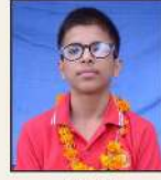
818680 अचिंत / अजीत प. नं. 290, साधनत पाना गोखेड़ी, रोहताक (हरि.)