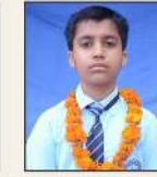
540379 पनमूल झांभ / तजीन्दुपाल 1663, एफ.ए.के. कैंप 10, रोड 64, सासनगर, मोहली (पंजाब)