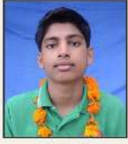
904623 मो. कैफ / मो. अस्लम सिंहकी सिद्धपुरा, गुरतली, पण्डारपुर तामखन ( हरि.)