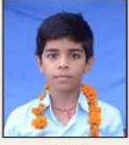
516605 कृष्ण कुमार / अंकन सिंह 26 बराल, सी. के.वेड प्रोडक्ली अहो, नाली ( हरि.)